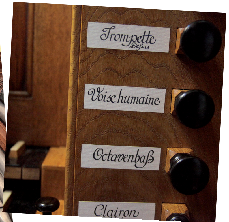
Orgue Silbermann de l'église Saint Maurice de Soultz (68)