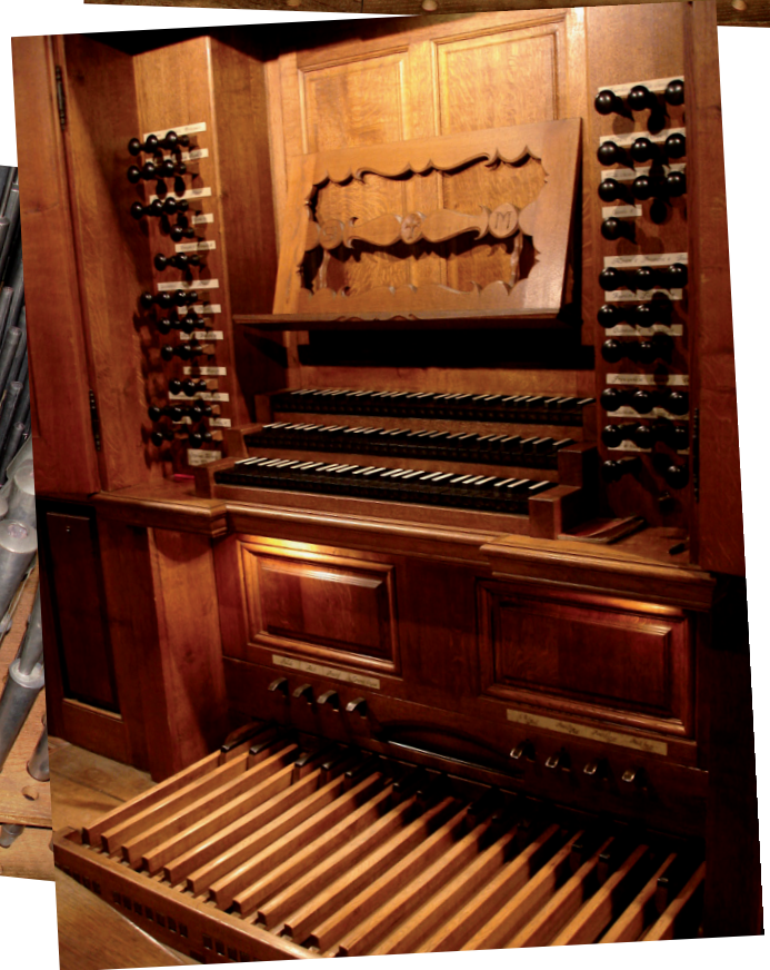
Orgue Silbermann de l'église Saint Martin de Colmar