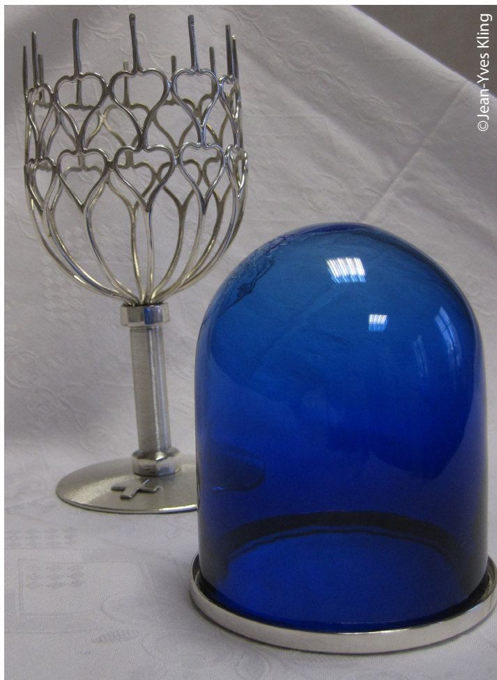
Les deux pièces démontées.