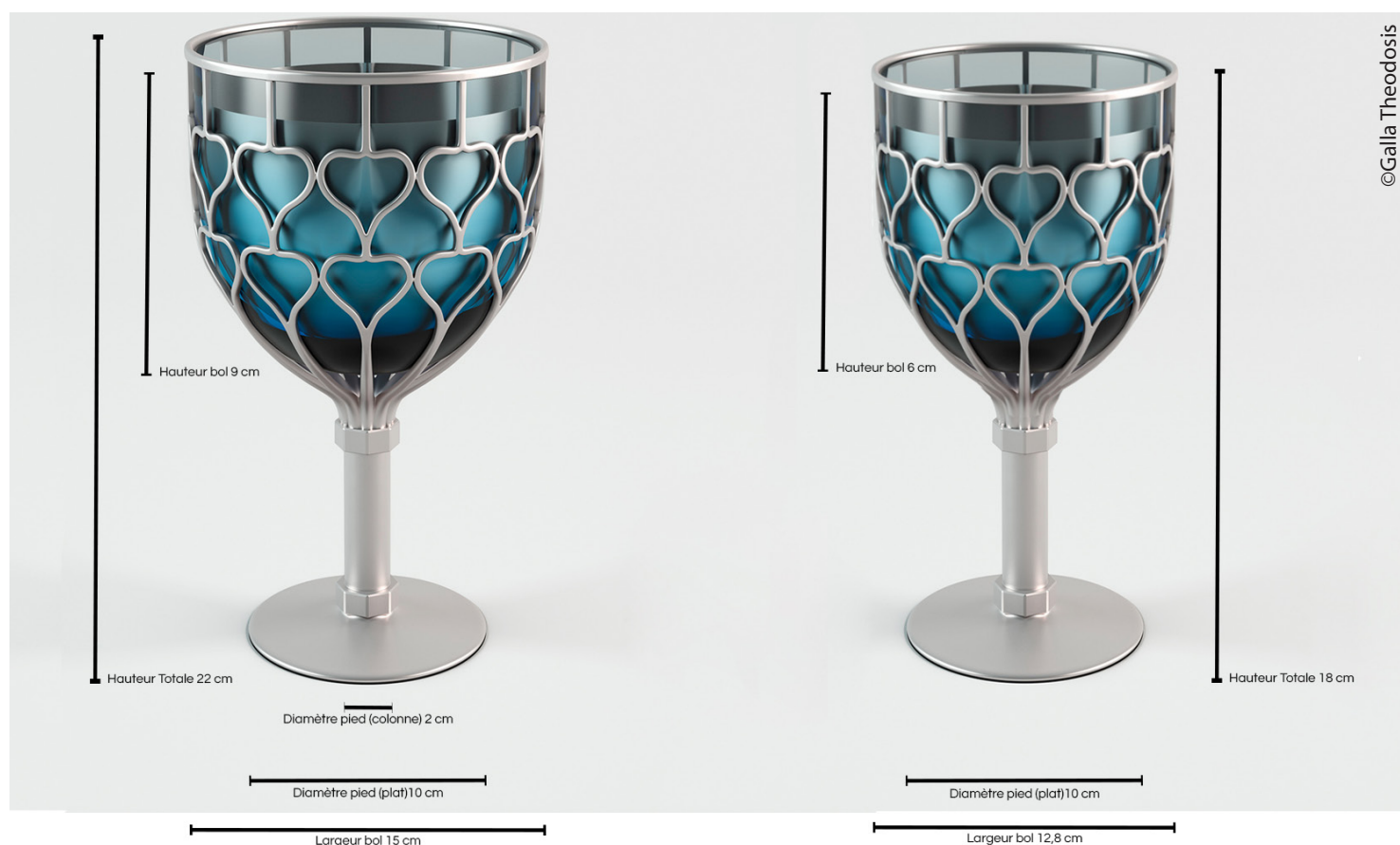
Proposition de calice pour le Millenium de N.-D. de Strasbourg