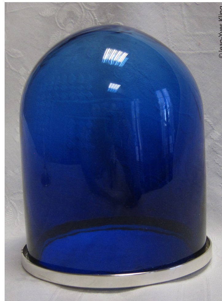
La coupe de verre et sa bague en argent.