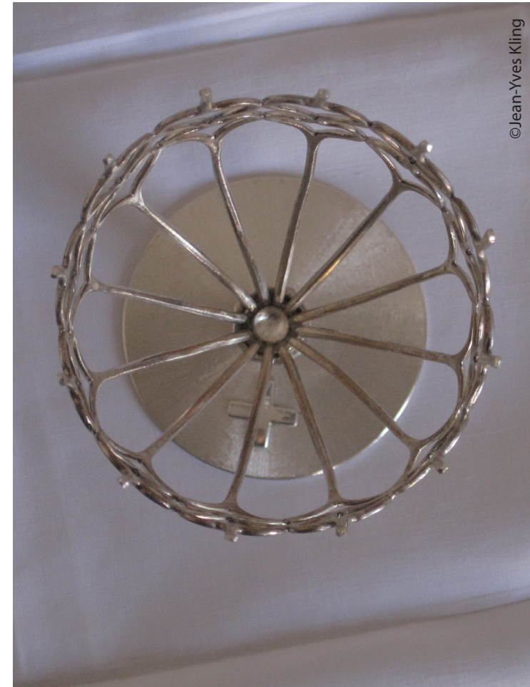
La structure en argent vue du dessus.