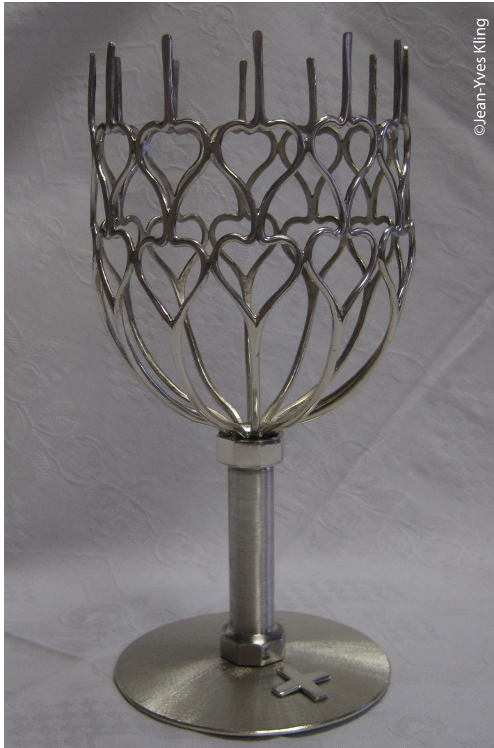
La structure en argent actuelle.