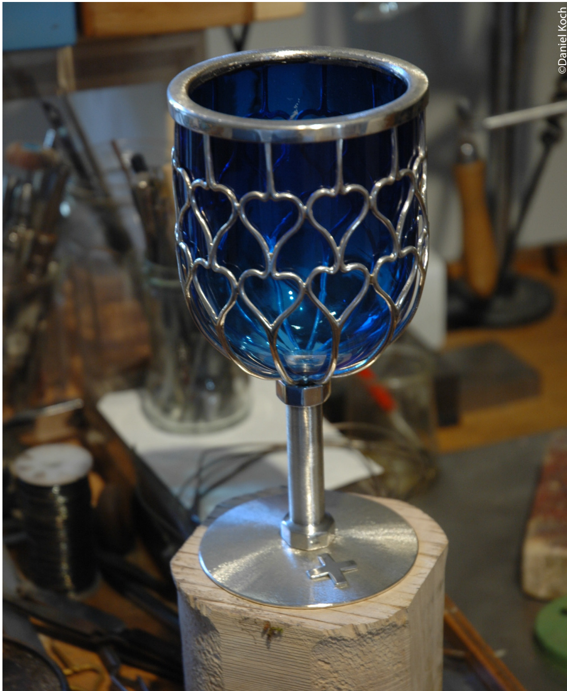
Le calice fini dans l'atelier.