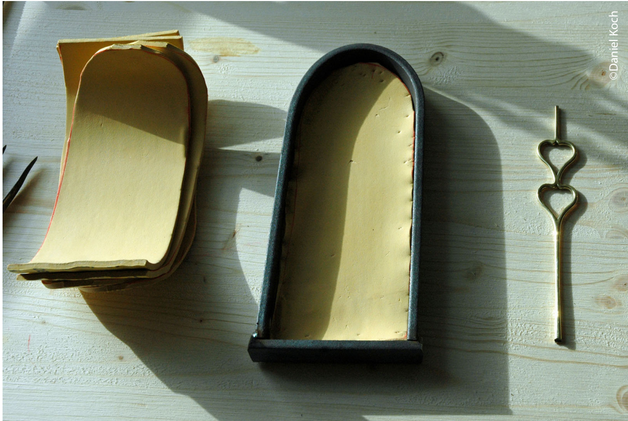
Réalisation du moule pour la coupe métallique.