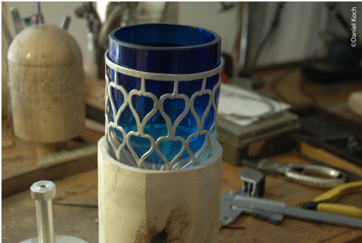
Mise en place de la coupe de verre.