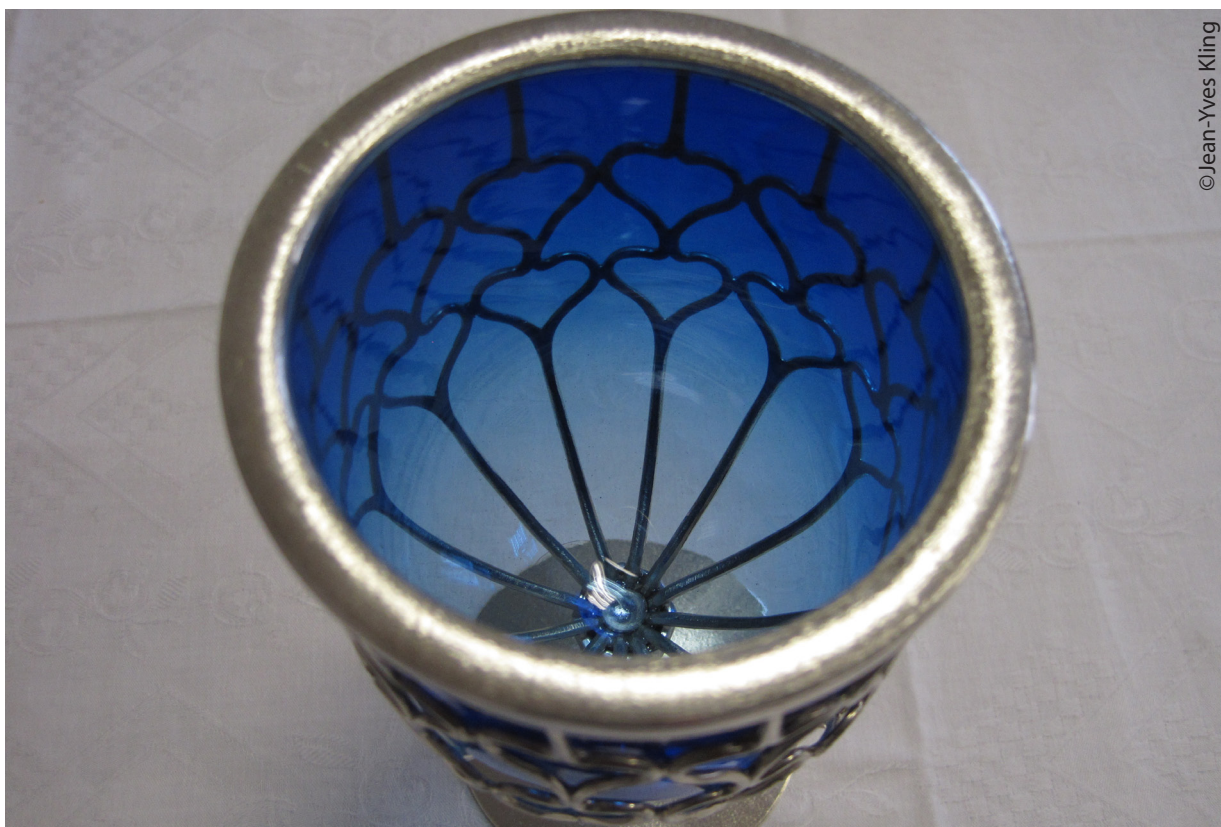
Intérieur de la coupe.