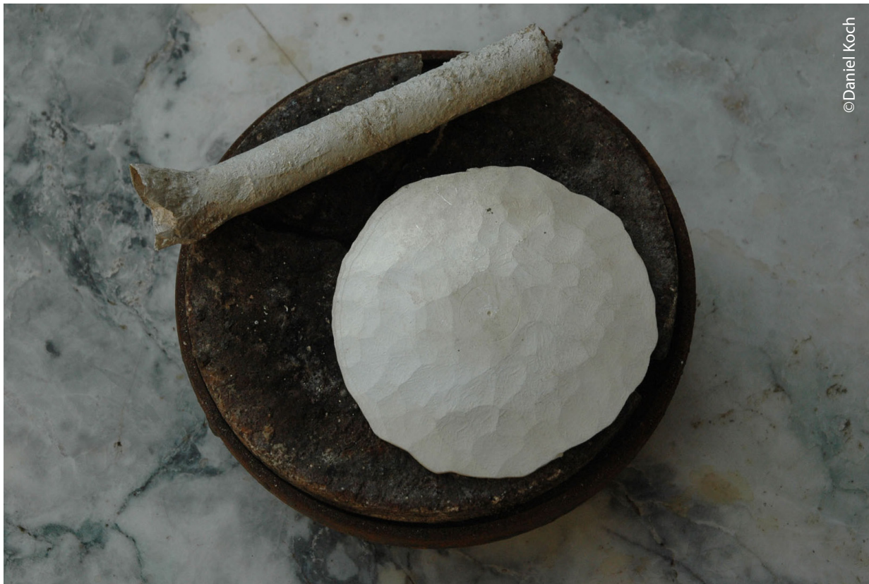
Mise en forme et martelage du pied.