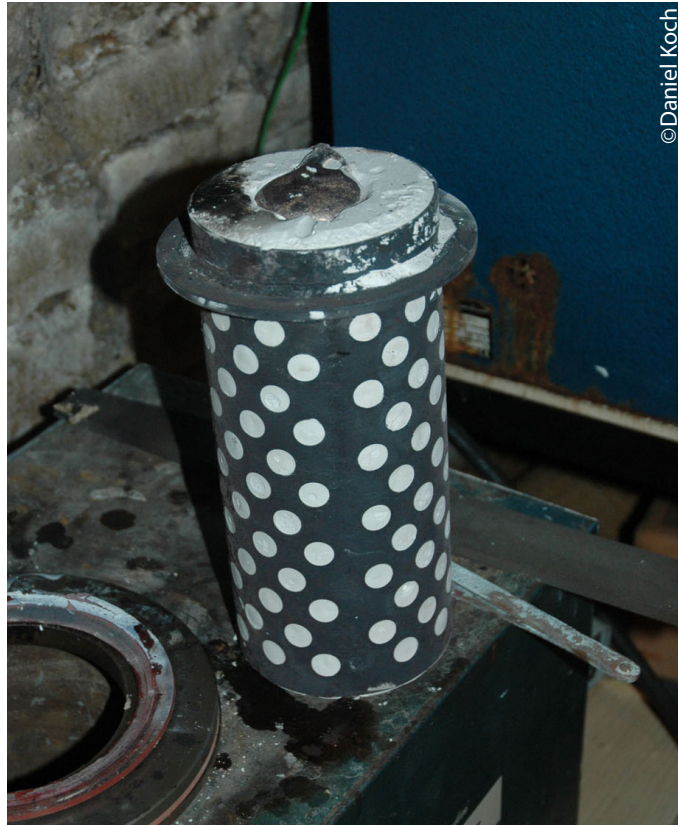
Tirage des cires pour la coupe métallique.