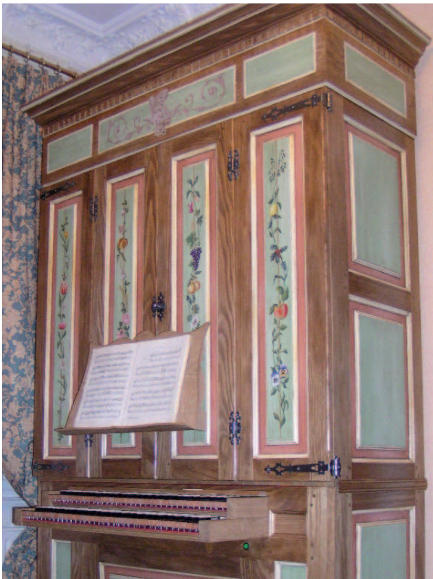
Sur les volets fermés, les fleurs et les fruits des quatre saisons.