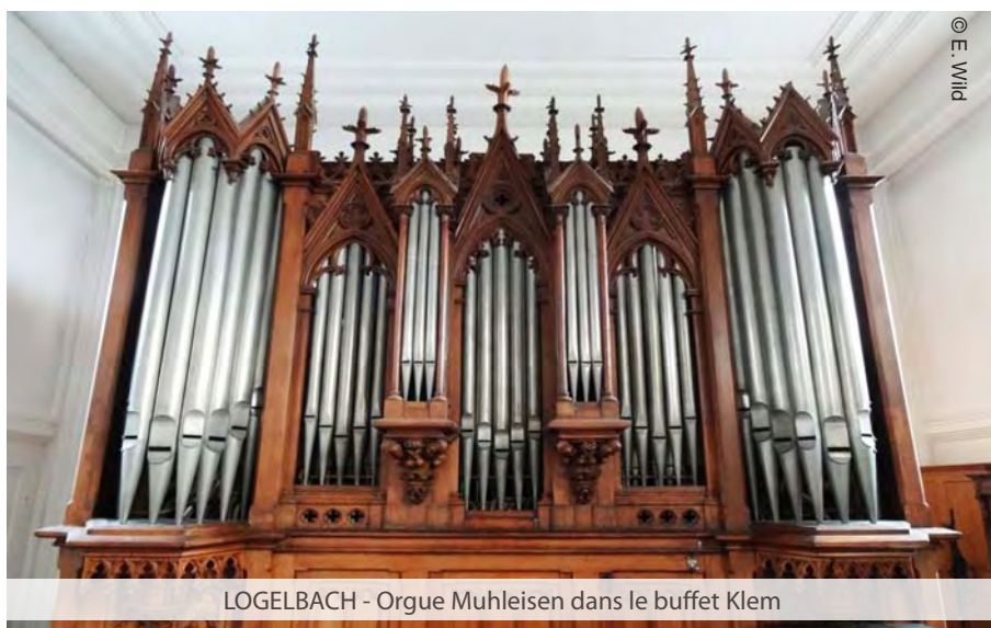
LOGELBACH - Orgue Muhleisen dans le buffet Klem

En 1966 l'orgue est refait par Muhleisen comme on faisait à l'époque : « baroquisation », nouvelle console mécanique (jurant avec le buffet néogothique Klem), beaucoup de métal : acier pour l'ossature et le tirage des jeux, alu pour l'abrégié. Toutefois aucun jeu encore existant n'est remplacé, une cymbale est ajoutée à chaque clavier grâce à une chape supplémentaire derrière chaque sommier. Tous les postages sont en « Westaflex », ces tubes souples industriels aluminium gainés de carton.