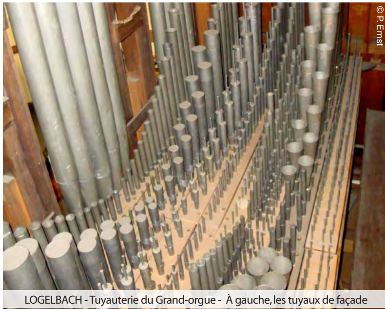
LOGELBACH - Tuyauterie du Grand-orgue - À gauche, les tuyaux de façade